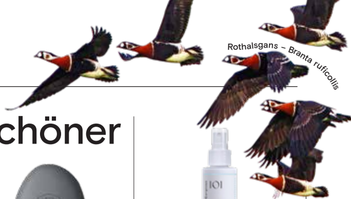
Rothalsgans – Branta ruficollis